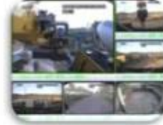
Civil Work Vehicle