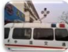
Traffic Inspection Car