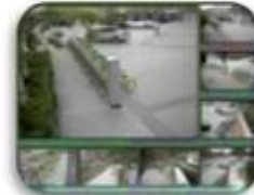
Fixed place monitor