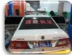
Road Police Car