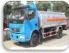
Dangerous chemical car