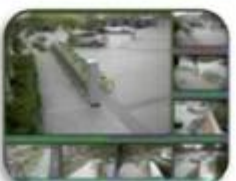
Fixed place monitor