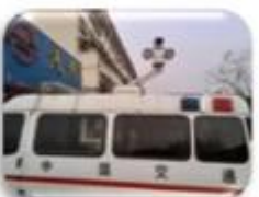
Traffic Inspection Car