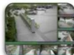
Fixed place monitor