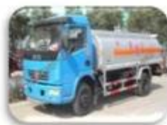
Dangerous chemical car