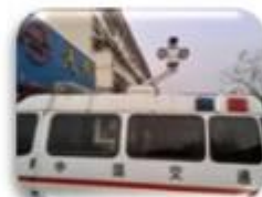
Traffic Inspection Car