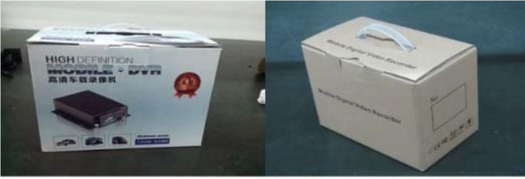
Richmor Brand Package

Nötr kağıt kutusu veya renkli kağıt kutusu logosu Richmor baskılı, ayrıca özelleştirilmiş paket hoş geldiniz.