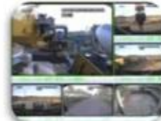
Civil Work Vehicle