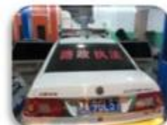
Road Police Car