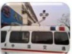
Traffic Inspection Car