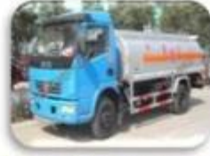
Dangerous chemical car