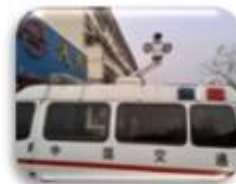
Traffic Inspection Car