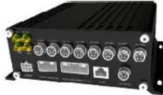
9108 Series- 8ch NVR /9204 Series- 4ch NVR