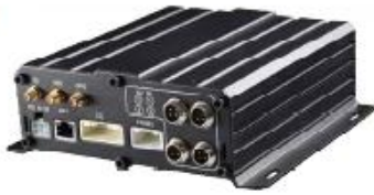
7104/7204 720P/1080P Series-AHD 4CH (Top Sale)