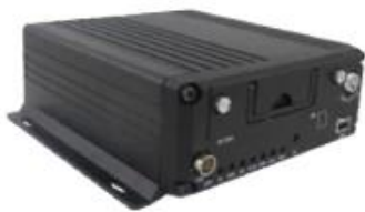
8114 Series- AHD 4CH