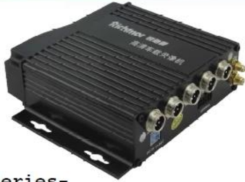
210 Series- AHD 4CH (Top Sale)