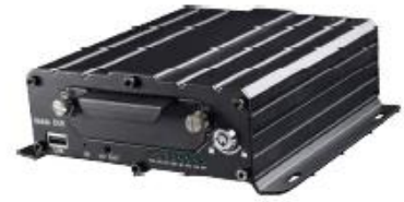
7105 Series- AHD 5CH