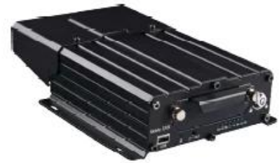
7008 Series- D1/720P 8CH