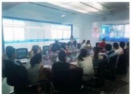
Technical Training For Fast Response to Customer Richmor 锐驰曼