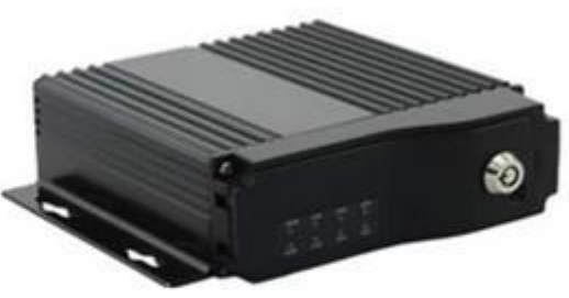
SD Mobile DVR with WIFI 3G GPS G-Sensor