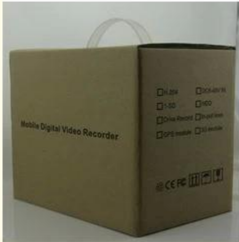
Brand Packing & Blister Packing