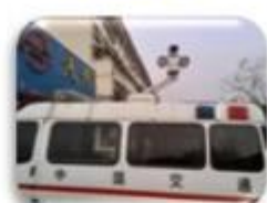
Traffic Inspection Car