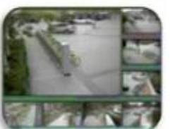
Fixed place monitor