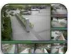
Fixed place monitor