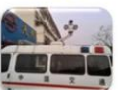
Traffic Inspection Car