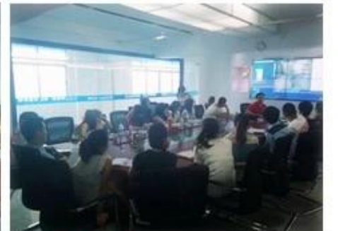
Technical Training For Fast Response to Customer Richmor 锐驰曼