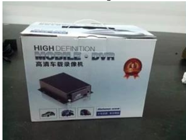
Richmor Brand Package