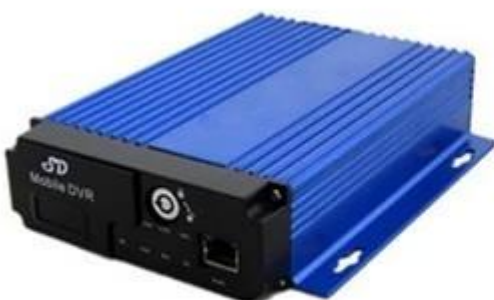
SD Mobile DVR with 3G GPS