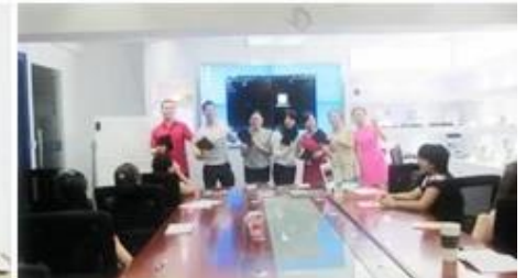
Inner Training after study from Alibaba in July