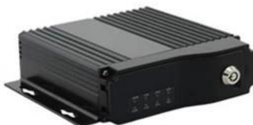
SD Mobile DVR with WIFI 3G GPS G-Sensor