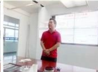
lecturer for Execution