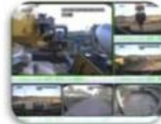
Civil Work Vehicle