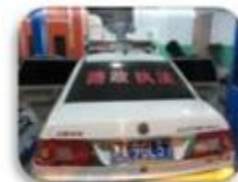
Road Police Car