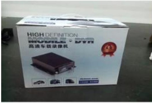
Richmor Brand Package