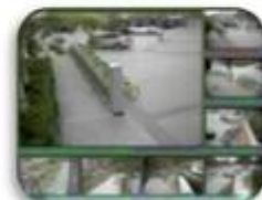
Fixed place monitor