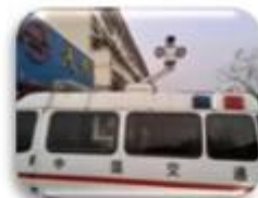
Traffic Inspection Car