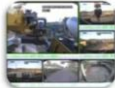
Civil Work Vehicle