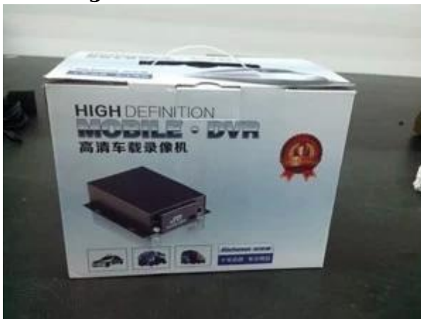
Richmor Brand Package