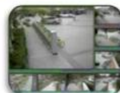
Fixed place monitor