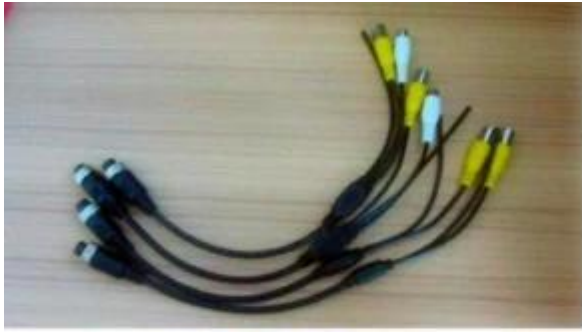
AV Input Cables