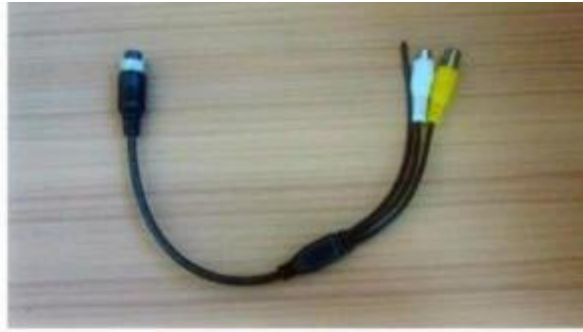
AV Output Cable