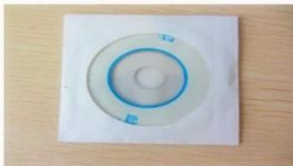
CD ( Manual & Software inside )