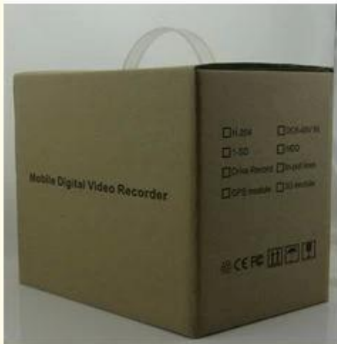
Brand Packing & Blister Packing