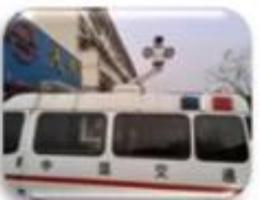
Traffic Inspection Car