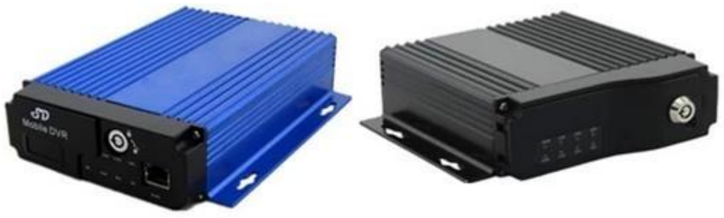
SD Mobile DVR with 3G GPS