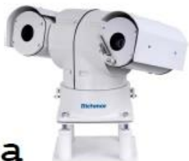
PTZ HD Camera Series