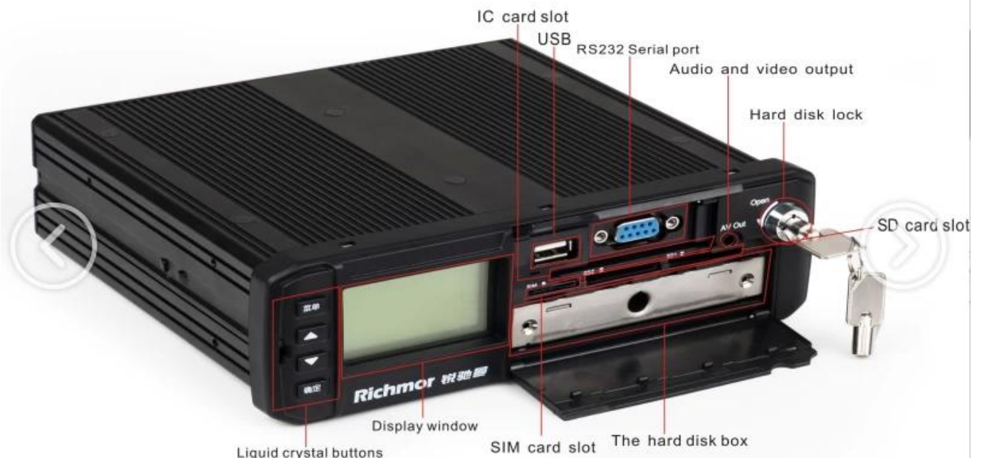
Immagine del prodotto: