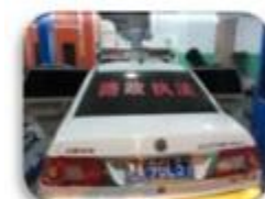
Road Police Car