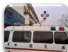
Traffic Inspection Car