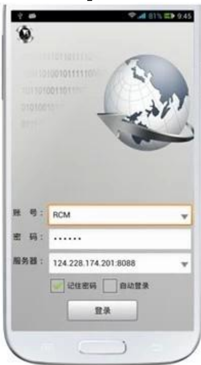
Per IOS & Android OS Sorveglianza del telefono mobile