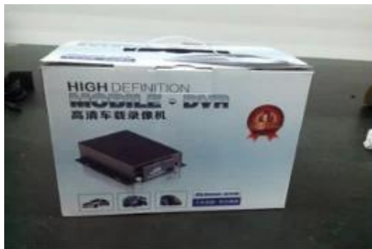
Richmor Brand Package