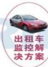
出租车 监控 解决方案