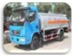
Dangerous chemical car