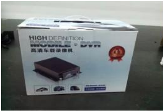
Richmor Brand Package