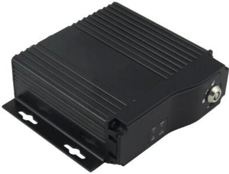
Device front view