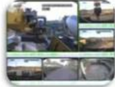
Civil Work Vehicle