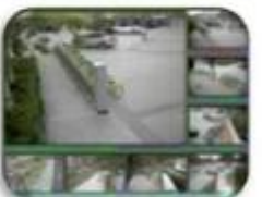
Fixed place monitor