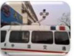
Traffic Inspection Car