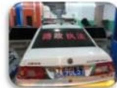
Road Police Car