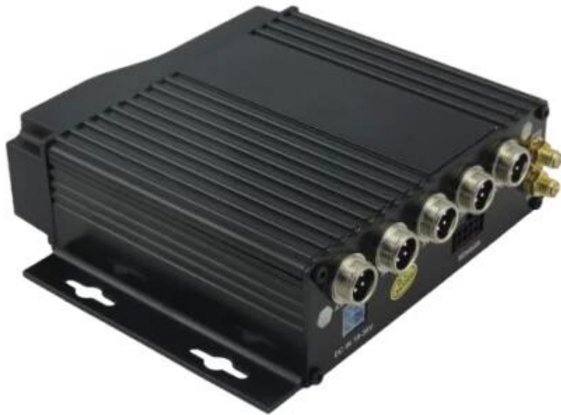
Device back view