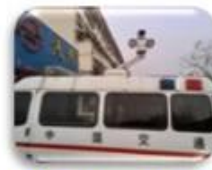
Traffic Inspection Car