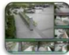
Fixed place monitor