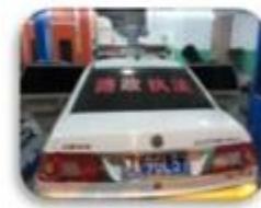
Road Police Car