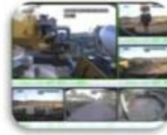
Civil Work Vehicle