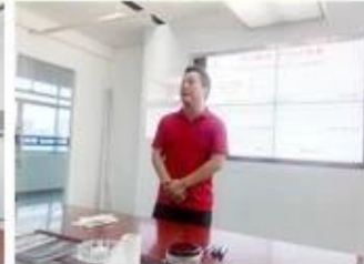
lecturer for Execution