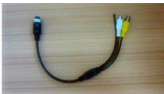
AV Output Cable