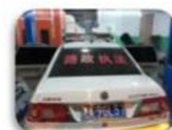
Road Police Car