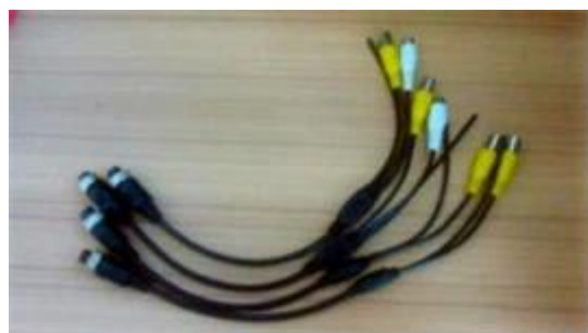
AV Input Cables

imprimé, accueillent également le paquet adapté aux besoins du client.