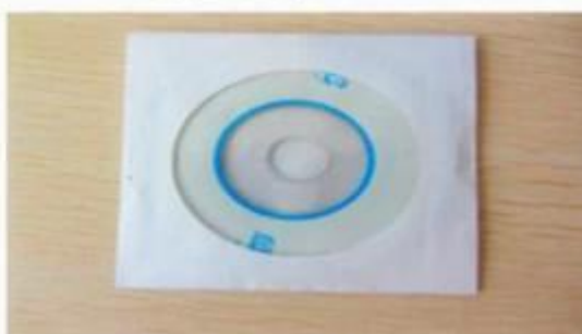
CD ( Manual & Software inside)