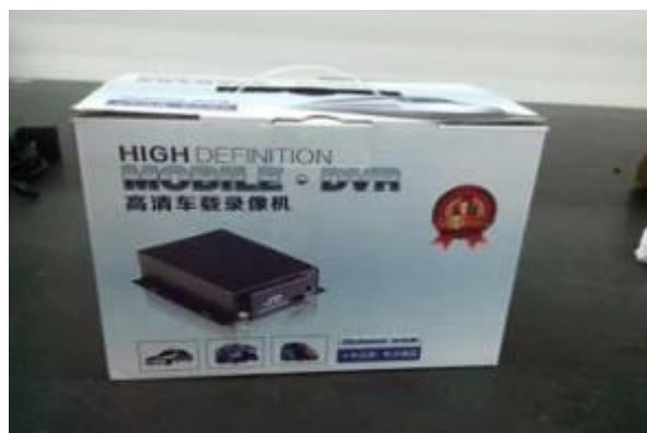
Richmor Brand Package