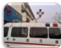
Traffic Inspection Car