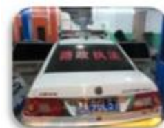
Road Police Car