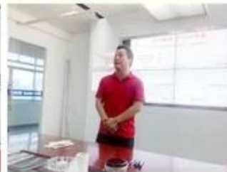
lecturer for Execution