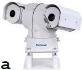
PTZ HD Camera Series