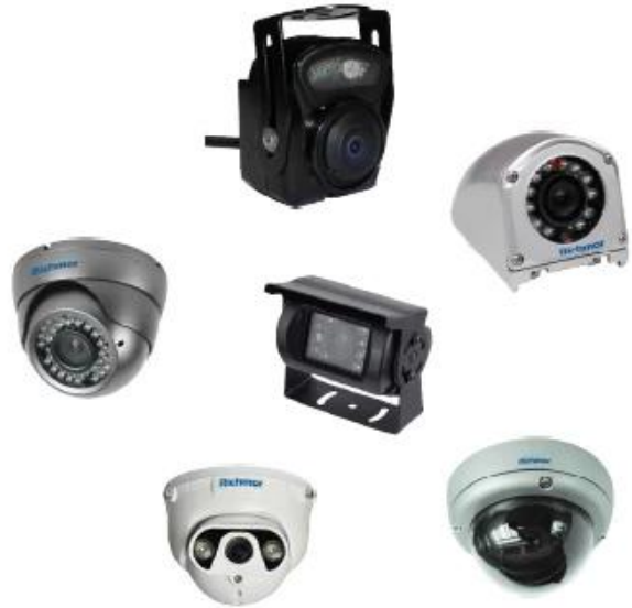
Car Camera Series