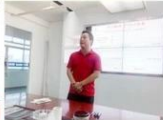
lecturer for Execution