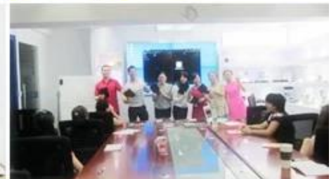
Inner Training after study from Alibaba in July