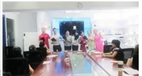
Inner Training after study from Alibaba in July