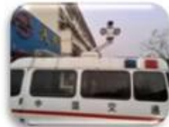
Traffic Inspection Car