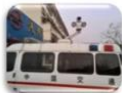
Traffic Inspection Car