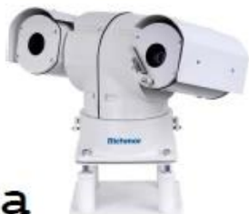
PTZ HD Camera Series