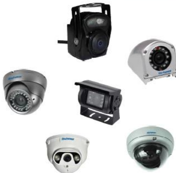
Car Camera Series