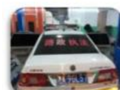
Road Police Car