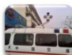
Traffic Inspection Car