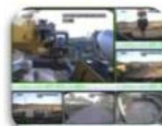
Civil Work Vehicle