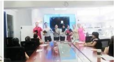
Inner Training after study from Alibaba in July