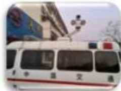
Traffic Inspection Car