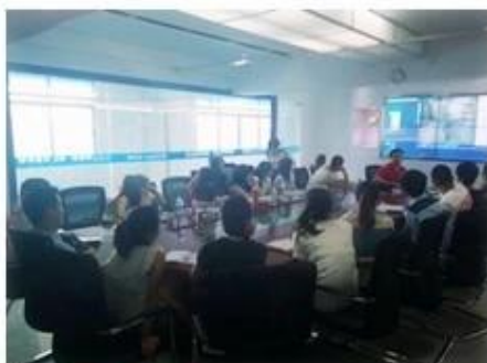
Technical Training For Fast Response to Customer Richmor 锐驰曼