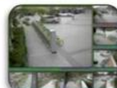
Fixed place monitor