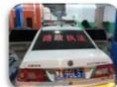
Road Police Car