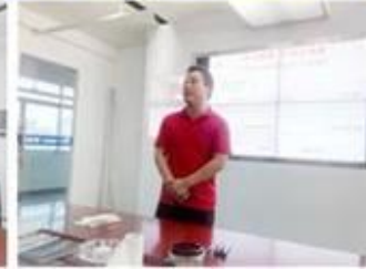
lecturer for Execution