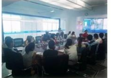
Technical Training For Fast Response to Customer Richmor 锐驰