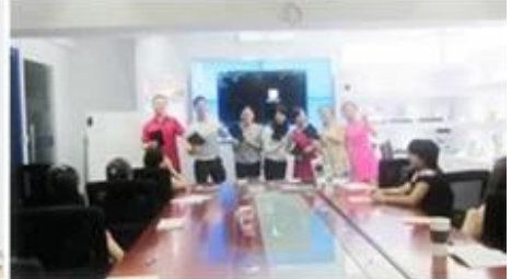
Inner Training after study from Alibaba in July