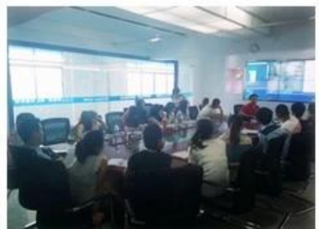
Technical Training For Fast Response to Customer Richmor 锐驰曼