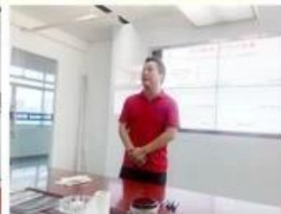
lecturer for Execution