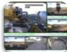
Civil Work Vehicle